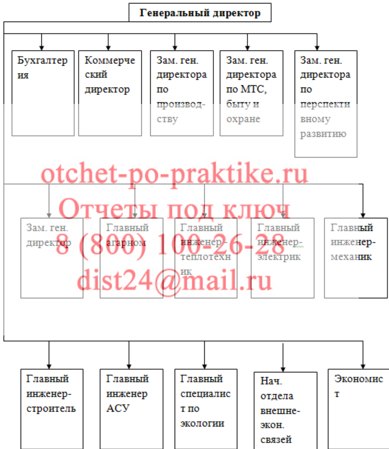
Рисунок 2.1 - Структура управления ООО «Бина-Агро Трейдинг»

Структура управления ООО «Бина-Агро Трейдинг» изображена на рисунке 2.1.